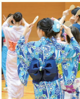
② 貴重な体験を写真で残す！