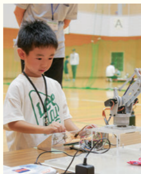
① 最先端技術を体験！