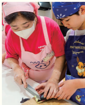
③ 美味しさの秘密とは！