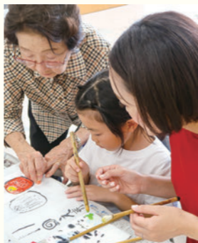
④ 大切な人へ想いを伝える！