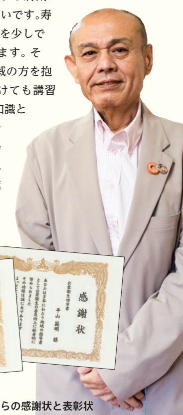
▲福岡市と福岡市衛生連合会からの感謝状と表彰状

今後は、時間が許せば、もう少し立ち入った健康講座をやりたいと考えています。「いきいき体操」は現在、歯科衛生士と栄養士にきていただいているのですが、そこに医師を加えて、特に高齢の方に関する病気についての講演をしてもらいたいです。寿命や認知に関する部分の不安を少しでも軽減できればと思っています。そして、特に高齢のご家族や親戚の方を抱えている50代前後の方に向けても講習を行いたいと考えています。知識として知るだけでも、いざ自分が介護しないといけない立場になったときに役に立つと思います。今後も積極的に地域の健康づくりの機会を増やしていきます。