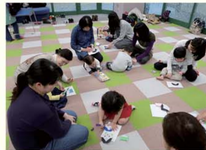
▲読み聞かせだけでなく工作など実施